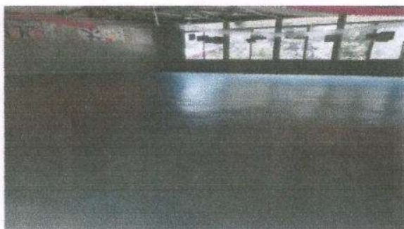
Foto 6. Sustitución de piso de tablaroca por concreto.