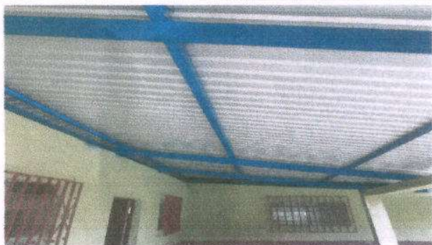
foto 3: Sustitución de estructura de soporte de madera, por metal.