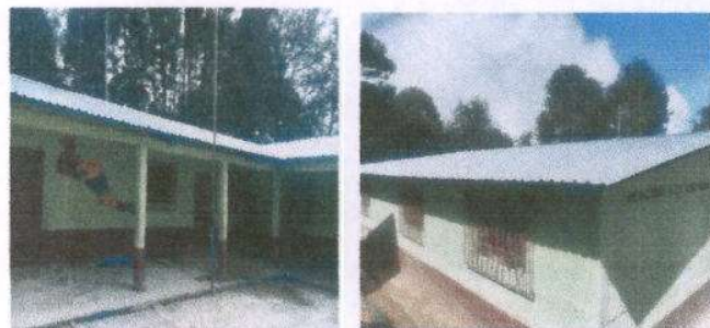
Foto 4 y 5: Sustitución de capote de lámina para lámina troquelada.