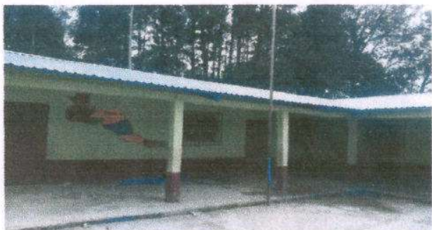
Foto1: Sustitución de lámina por lámina troquelada aluzinc calibre 26.