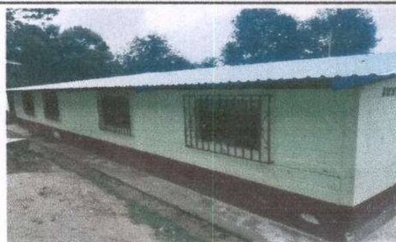
Foto 2: Sustitución de lámina por lámina troquelada aluzinc calibre 26.